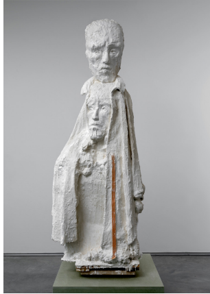
Double Van Gogh 2022-2023 Gips 192 x 75 x 45cm